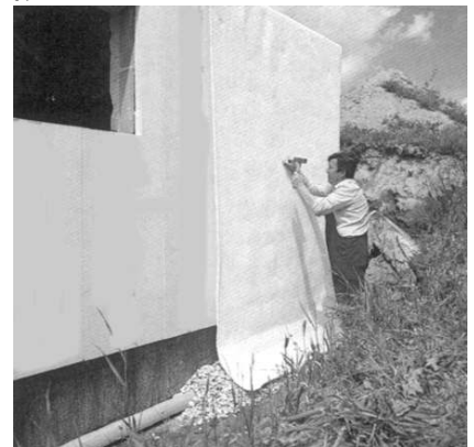
Schutz durch Anbringung einer Wärmedämmung und Schutzvlies.