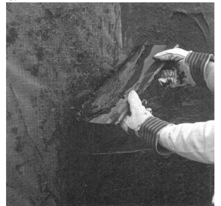
2. Beschichtung Villafalt 1 K Plus unverdünnt mit Spachtel in einer Schichtdicke von mind. 3 mm aufziehen. Verbrauch: mind. 3,0 - 4,0 ltr/m 2