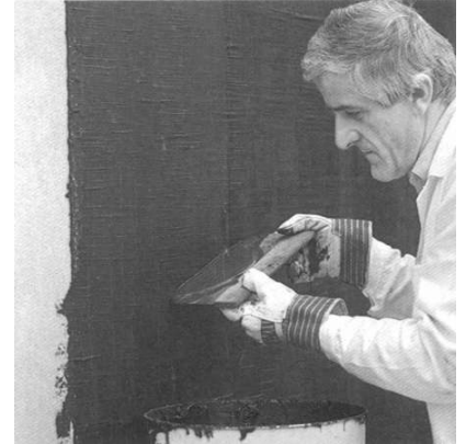
1. Beschichtung Villafalt 1 K Plus unverdünnt mit Spachtel in einer Schichtdicke von mind. 3 mm aufziehen. Verbrauch: mind. 3,0 - 4,0 ltr/m 2